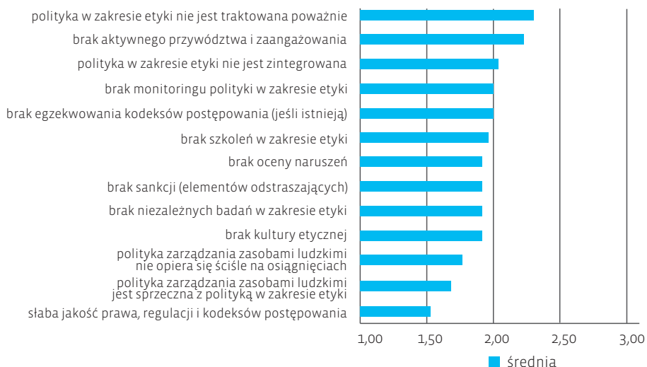
Ilustracja 2. Główne przeszkody w skutecznej realizacji polityki etycznej

Główne przeszkody w skutecznej realizacji polityki etycznej, opisane w publikacji Effectiveness of Good Governance and Ethics in Central Administration: Evaluating Reform Outcomes in the Context of the Financial Crisis , zaprezentowano na ilustracji 2.